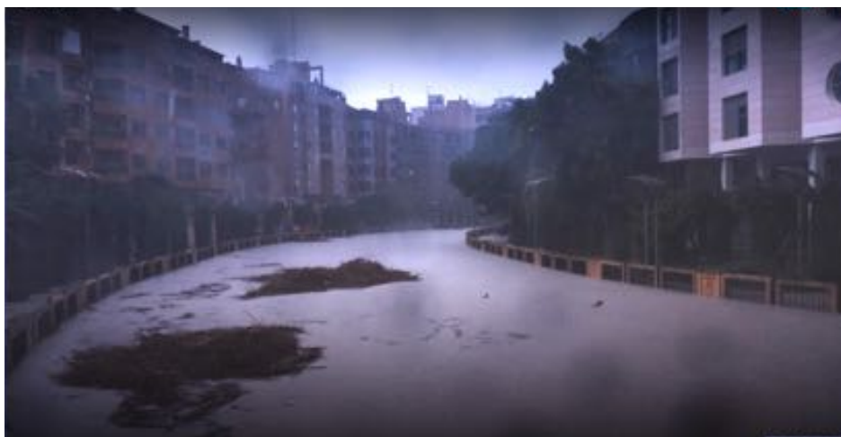
Fotograma de la película El agua (Elena López Riera)

Muchas generaciones de distintas familias de esta región, abarcando siglos, mantienen esa “relación extrema” con el agua, como lo ha hecho la familia de la propia cineasta, según ha relatado en muchas entrevistas, a raíz de la presentación de su película. A partir de esas cíclicas y fatales inundaciones, se han generado una serie de relatos casi míticos que la directora escuchó durante toda su vida de boca de las mujeres de su familia. Historias referidas al agua, lógicamente, como también relativas a las mujeres y a sus circunstancias sociales. Creencias, mitos y leyendas transmitidas oralmente, generación tras generación, que López Riera integró en el relato de su película.