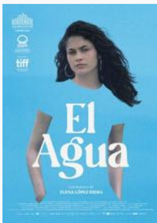
Cartel 1. Estreno España