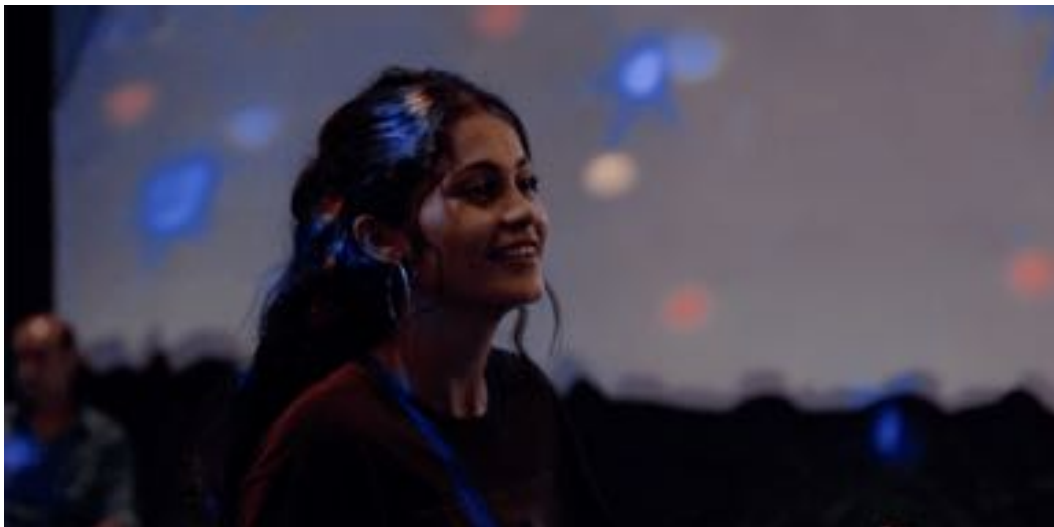
Fotograma de la película El agua (Elena López Riera)

"El objetivo principal de mi práctica artística es transgredir los límites entre nociones aprendidas, transmitidas y repetidas ; como lo masculino y lo femenino, la creencia y el escepticismo, la realidad y la fantasía, el documental y la ficción, a través de imágenes en movimiento." - (1).