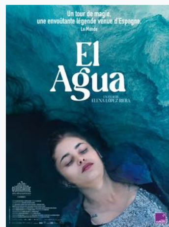
Cartel 3. Estreno Francia