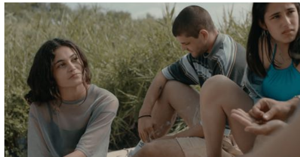
Fotograma de la película El agua (Elena López Riera)

Lo más importante para una chica o un chico joven es pasar tiempo con sus amigas y sus amigos de la misma edad, con los que puede descubrir y explorar todo, incluido el deseo. En un contexto delimitado geográficamente como una comarca, un valle, una ciudad pequeña o un pueblo, la juventud, al igual que el agua embalsada, busca inexorablemente la forma de descubrir nuevos cauces y fluir.