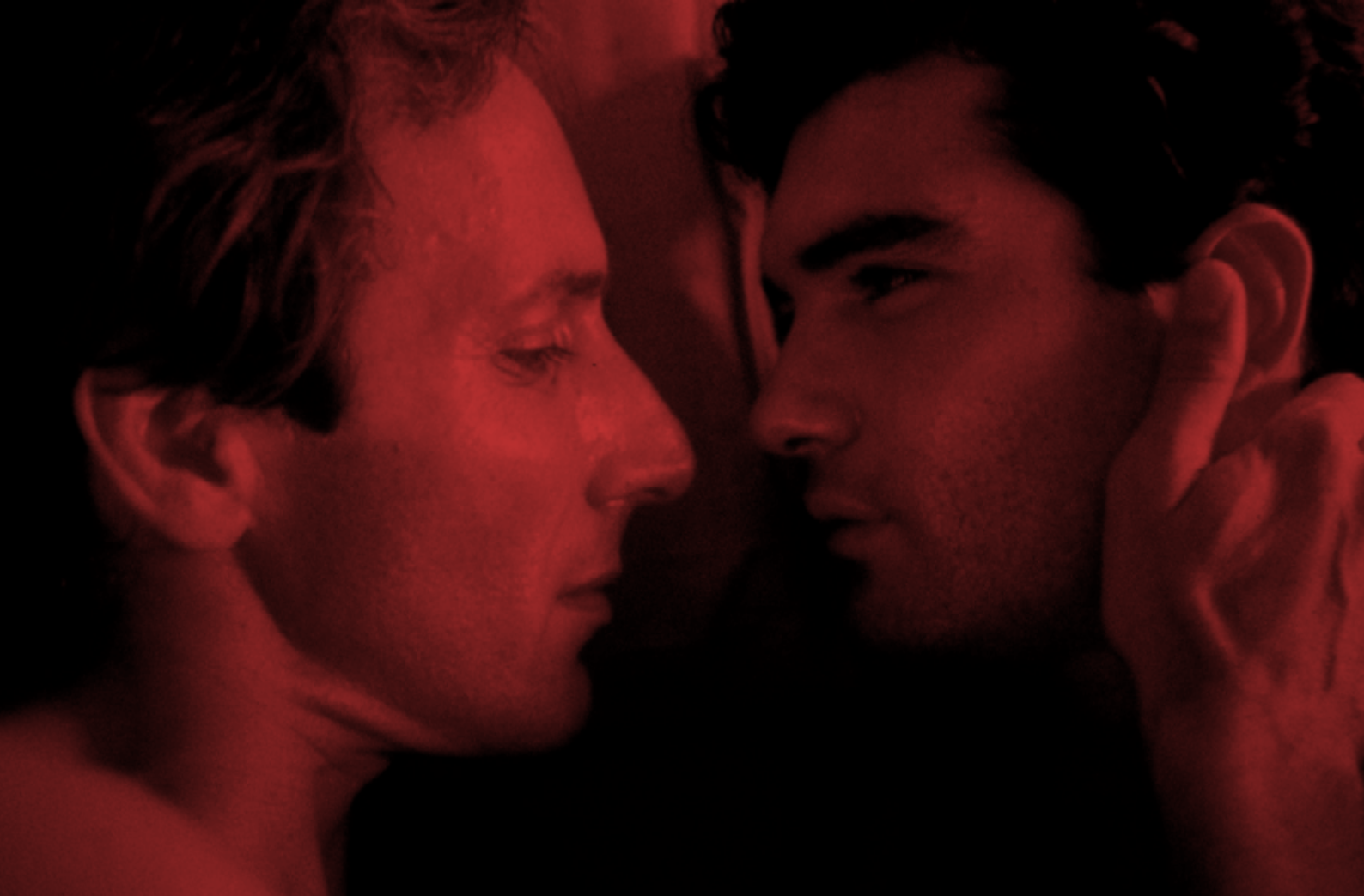
La ley del deseo (Pedro Almodóvar, 1987)