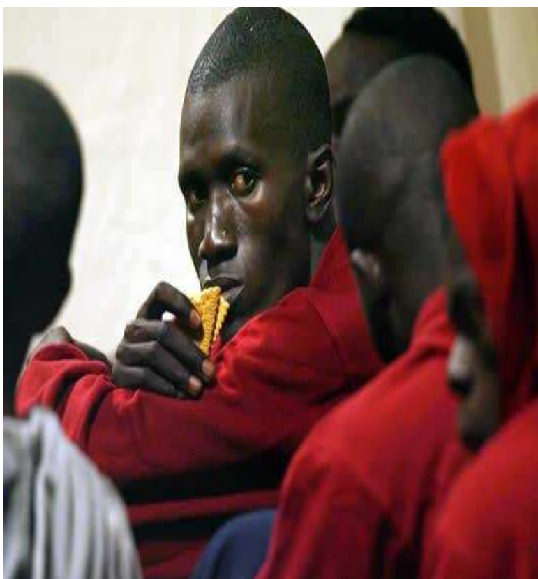
GRUP D'IMMIGRANTS ARRIBATS A TENERIFE